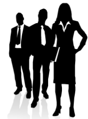
Vacancy Directeur des utilisateurs du port

Creating an International, Integrated Transportation Hub.